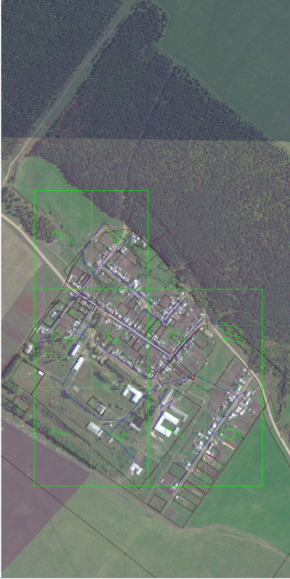
Схема размещения листов